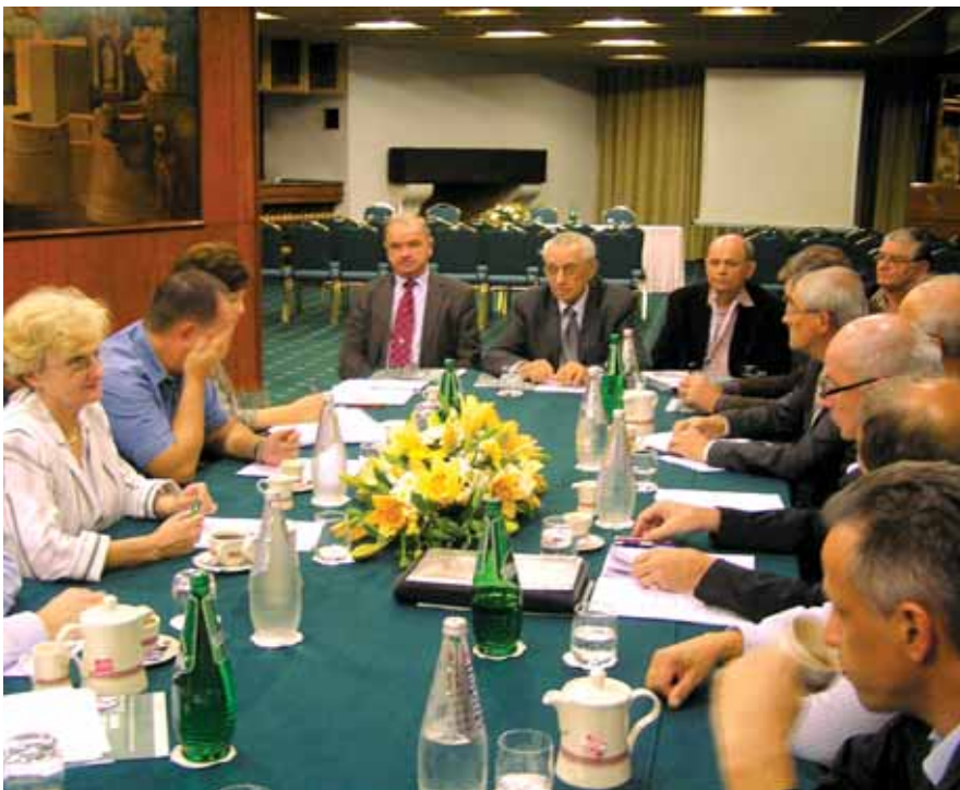
Sudionici sjednice Predsjedništva HSGI-a

Nakon usuglašavanja prijedloga dnevnog reda Skupštine i skupštinskih tijela, još su jednom razmotrene završne pripreme za Sabor hrvatskih graditelja 2008. koji tek što nije započeo. Pripreme su ocijenjene vrlo uspješnim tako da nema nikakve sumnje da će i V. Sabor hrvatskih graditelja biti uspješno organiziran. Posebno je pohvaljen doprinos agencije Atlas , stalnog tehničkog suradnika u organizaciji Sabora .