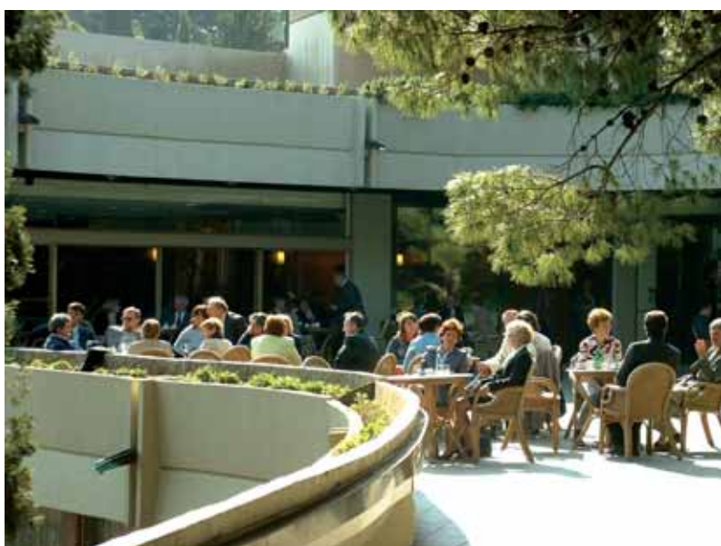
Rad na desku (gore) Sudionici prošlog Sabora (lijevo) Dio izložbenog prostora ovogodišnjeg Sabora (dolje)